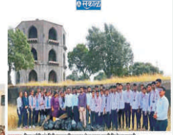
छत्रपती अभियांत्रिकी महाविद्यालयामध्ये तीन दिवसीय कार्यशाळा पार पाडली.