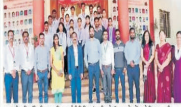
छत्रपती अभियांत्रिकीच्या २५ विद्यार्थ्यांची विविध इंडस्ट्रीमध्ये कॅम्पस प्लेसमेंटद्वारे निवड झाली.